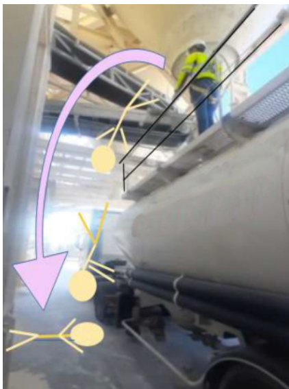
Recreación de la caída desde la pasarela del camión (causa no determinada).