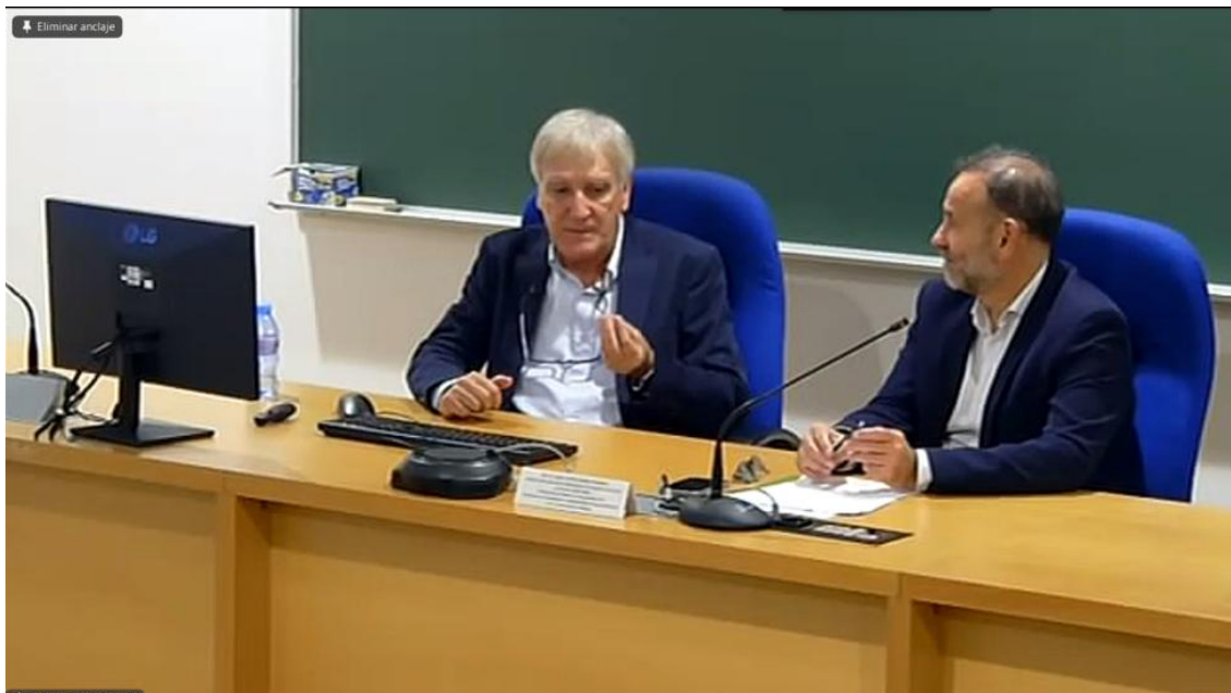
El Director del LADEP durante su conferencia en la jornada organizada por LAGEPYME y la Cátedra de Prevención y Responsabilidad Social Corporativa. Universidad Málaga