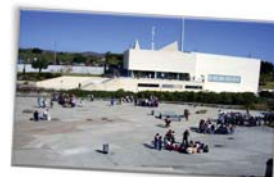
Instituto Europeo de la Alimentación Mediterránea (IEAMED)