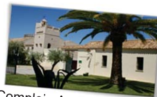
Complejo Agroalimentario Hacienda de Quinto