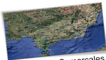
60 Oficinas Comarcales Agrarias (OCAs)

123 centros de trabajo por toda Andalucía.