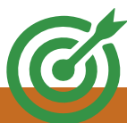
Figura 9. Plantilla 4.4. Definición y justificación de aspectos innovadores.