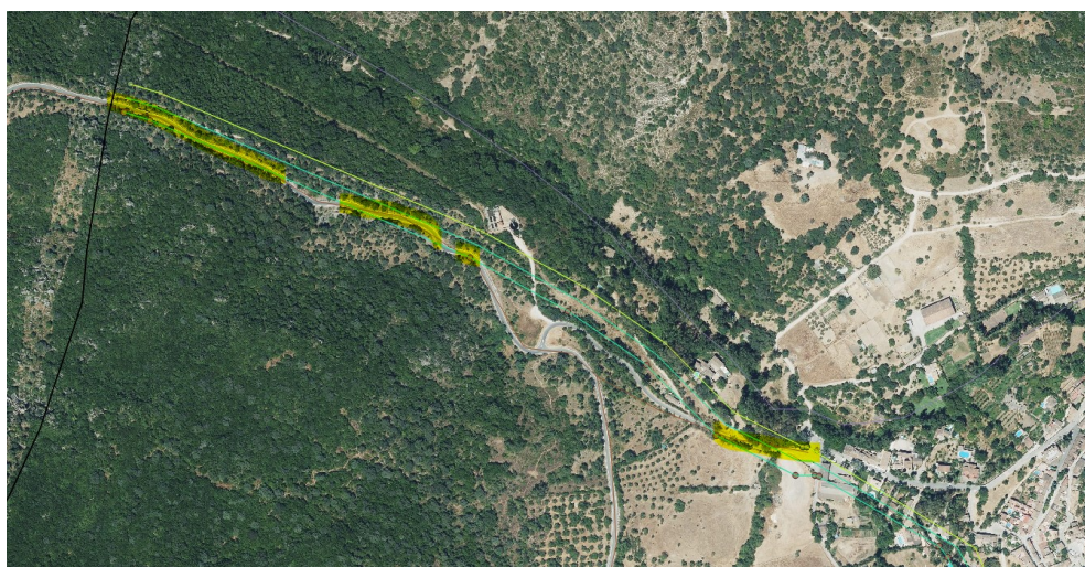
Figura 2. Detalle de afectación de la actuación a la vía pecuaria 11019006.