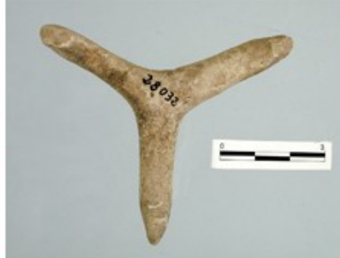
LÁMINA 3 Museo del Conjunto Arqueológico de Alhucemas