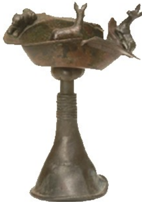
LÁMINA 4 Gadesa Chica