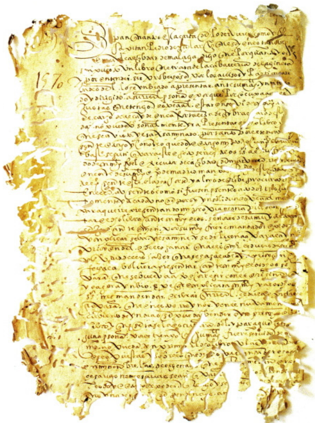
Figura 3. 1570, septiembre, 27. Málaga. Pedro de Aguilar, alcalde de Gibralfaro, da poder para que su libro sobre la caballería de la ginetá sea presentado en el Consejo Real y obtener permiso para su impresión y venta. Archivo. Histórico Provincial de Málaga. Sección Protocolos Notariales leg. 472. fol 59-v