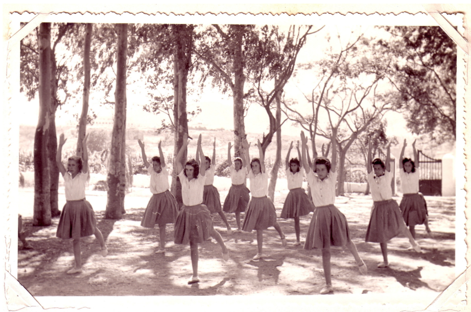
Figura 4. Imagen de jóvenes practicando actividades deportivas en un campamento de Torremolinos. Archivo Histórico Provincial de Málaga. Fondo Delegación Provincial de Sección Femenina. Campeonato Provincial de Gimnasia. Signatura F-01/01/23-17

En sus colecciones 32 se halla el Archivo Privado de José Mario Armero, abogado, periodista y director de Europa Press. A lo largo de su trayectoria profesional coleccionó un buen número de carteles, tarjetas postales, banderas, símbolos de ambos bandos, nacional y republicano, y objetos de decoración. Entre estos podemos destacar: