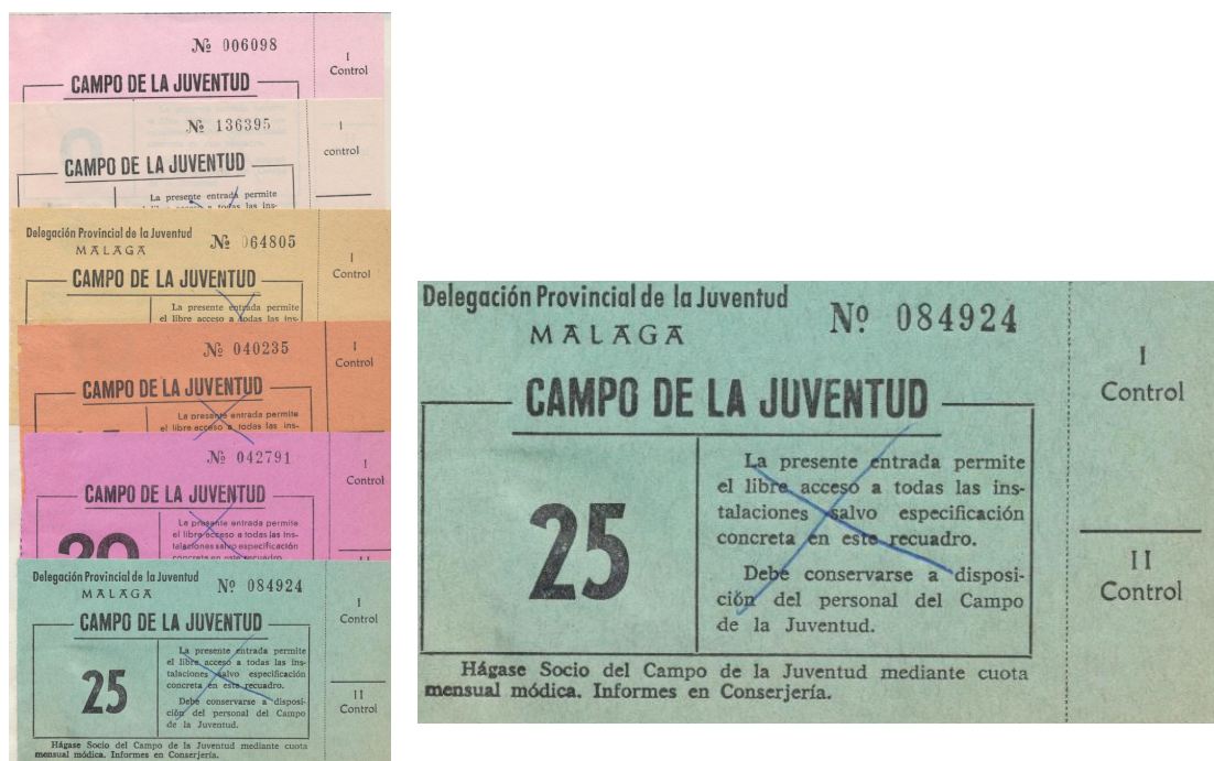
Figura 1. Muestra de entradas en diferentes colores. Archivo Histórico Provincial de Málaga. Fondo Delegación Provincial de Juventud. Signatura 29565.

De esta forma la documentación debe ser conservada de manera organizada y ordenada, integrando el conjunto de documentos de una institución, o lo que en lenguaje archivístico denominamos fondo; cada institución, cada organismo, produce un fondo documental que debe estar identificado y diferenciado. Estos conjuntos documentales están a su vez compuestos por las series documentales o tipos de expedientes, como materialización de los procedimientos.