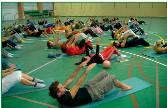
En el mes de julio se celebrará un curso de Pilates avanzado.

El mayor especialista mundial en tendinitis, el finlandés Sakari Orava, y el seleccionador nacional de balonmano de Francia, Claude Onesta, entre los ponentes más destacados