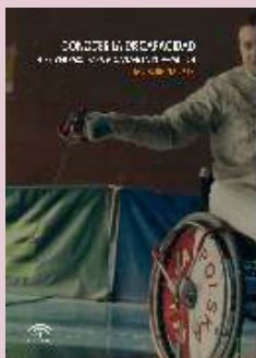
Portada de la publicación digital sobre deporte adaptado

El primero de ellos, dirigido a los docentes, propone material didáctico que enseña a los alumnos a conocer la discapacidad. Otro apartado habla de la oferta existente en deporte adaptado, cómo se gestionan estas disciplinas y sus antecedentes históricos. El segundo libro pretende formar a profesionales especializados en la gestión de campos de golf. Esta herramienta electrónica quiere ser útil para la toma de decisiones relacionadas con la administración de estas instalaciones. Además, incluye una encuesta realizada a los profesionales sobre el tipo de formación que prefieren.