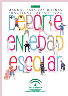
Portada de la publicación.

La Consejería de Turismo, Comercio y Deporte ha editado un Manual de Buenas Prácticas que recoge orientaciones metodológicas relacionadas con la planificación, organización y ejecución de cada una de las actividades incluidas en el primer Plan de Deporte en Edad Escolar de Andalucía. Esta iniciativa, en la que también participan las consejerías de Educación y de Salud, incluye programas de actividades que se desarrollan en horario no lectivo, son de participación voluntaria y van dirigidos a la población escolar (de entre 6 y 18 años) que reside en la comunidad andaluza.