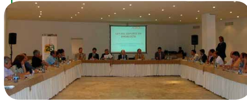
Imagen del encuentro entre federaciones.