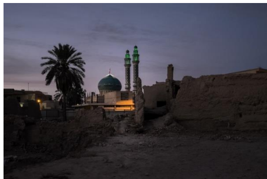
© Manolo Espaliú. Sin título 2016