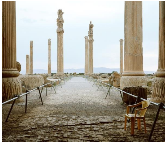
© Manolo Espaliú. Sin título 2016