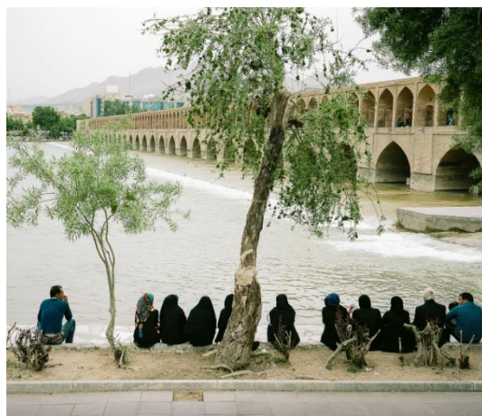
© Manolo Espaliú. Sin título 2016