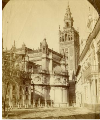
“Sevilla. Catedral. La Giralda” [Desde la puerta del Patio de Banderas del Alcázar]