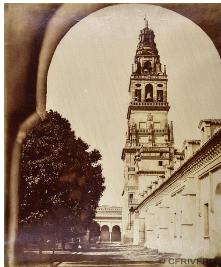
“Córdoba. Mezquita, la torre”