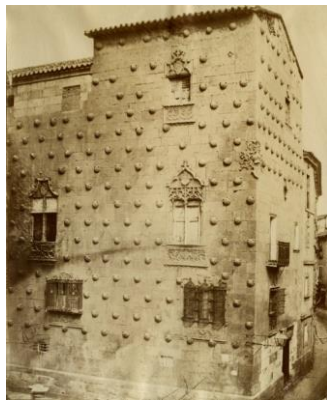
[Salamanca. Casa de las Conchas]