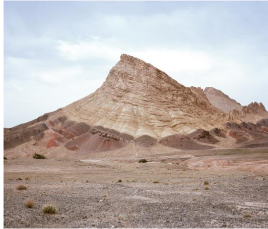
© Manolo Espaliú. Sin título 2016